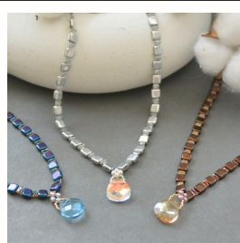
ホリデースパークル